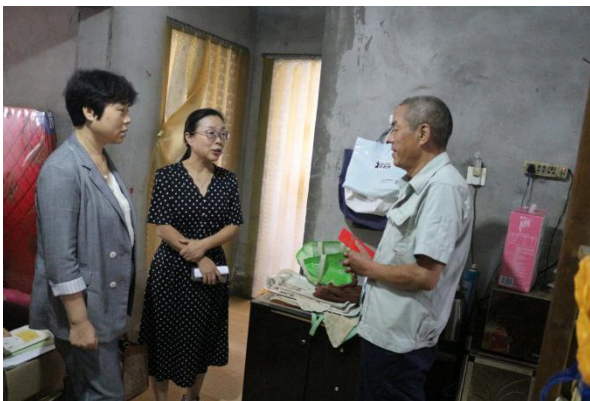
图表 2 - 7 慰问困难家庭