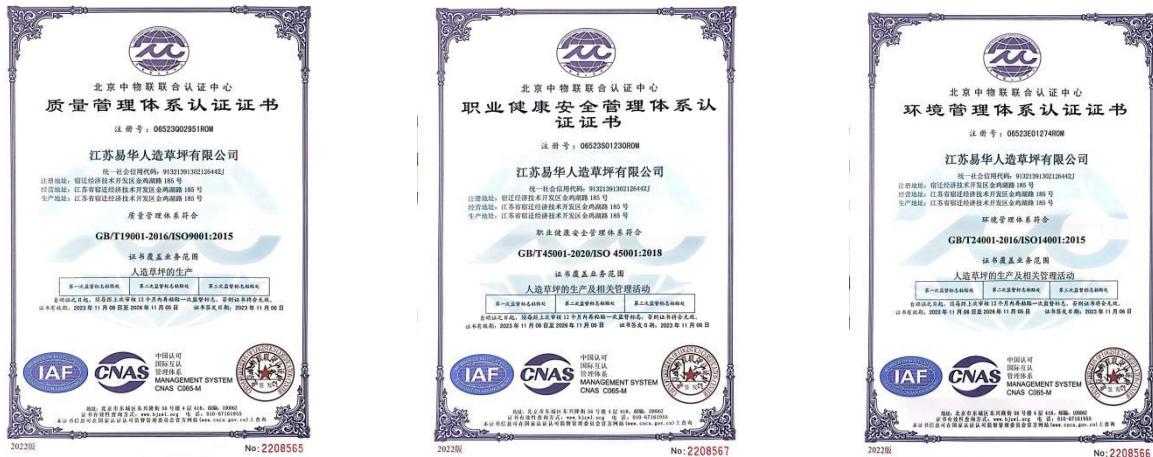
图表 2-1 公司获取的质量、环境、职业健康、知识产权体系证书

为谋求企业与社会的和谐发展，公司在取得合理利润与经济效益以外积极履行社会公共责任和公民义务，在环境保护、能源消耗、安全生产等方面认真执行国家有关法律法规，通过导入实施 ISO 三体系，每年签订安全生产责任书，真正做到企业对社会负责。在道德行为方面一直创建诚信企业，兼顾顾客、员工、供方等权益的共赢。在公益事业方面也积极响应，以高层领导为带头，全部员工积极参与的方式来回馈社会。