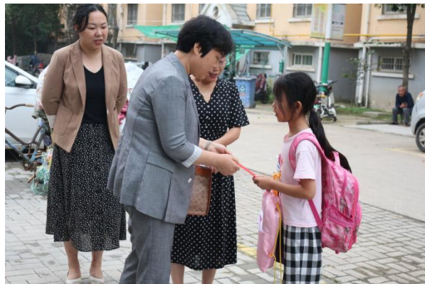
图表 2 - 8 捐赠票据、资助困难学生