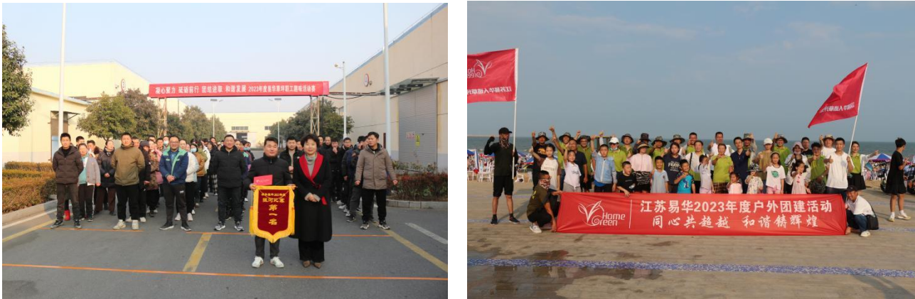
图表 2-4 员工趣味活动赛、户外团建

江苏易华将创建全球最具竞争力的人造草坪企业，对内通过关爱员工的一系列举措来体现诚信。近年来企业经济效益的稳步提高，也让全体员工共享了企业发展的实惠，员工人均年收入以每年超过 8%-10% 的幅度提升，并写入了职工代表大会工作报告。