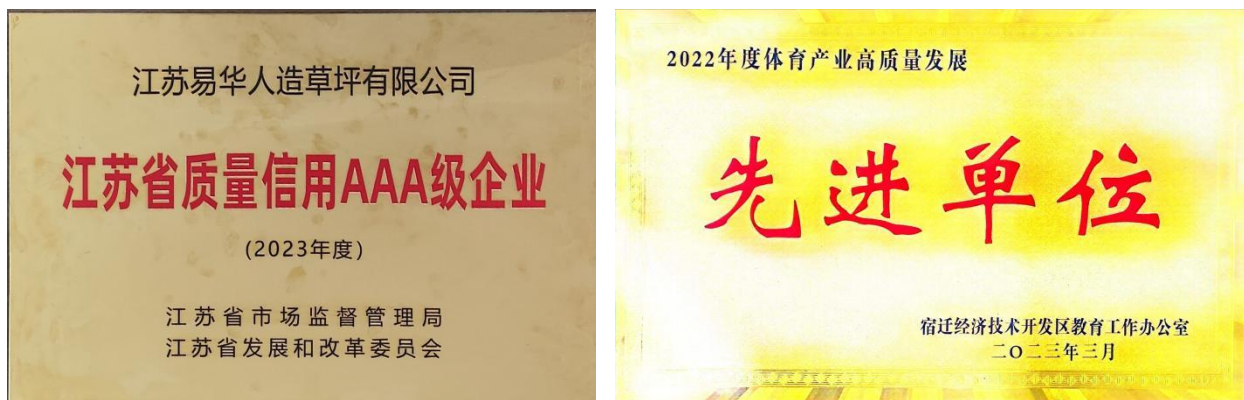
图表 2-5 江苏省质量信用AAA级企业、体育产业高质量发展先进单位

1) 对社会通过上缴税金逐年递增，积极履行企业社会责任。江苏易华每年上交的税金稳步攀升。企业通过优化产品结构，实现效益稳步增长。2023年上交各项税款近 1000 万元。