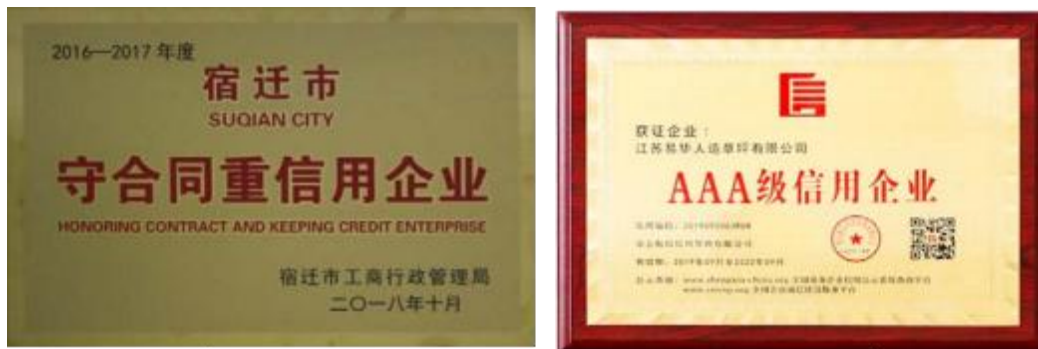
图表 2 - 6 守合同重信用企业、3A 级信用企

2) 科学保护环境，持续技术改造，实现节能减排。在发展壮大企业的同时，江苏易华高度重视节约能源、清洁生产、绿色环保。在生产与环境的和谐发展中尽心履责。建新项目先考虑环境工艺的先进性与能耗综合指标的先进性，在引进全套生产线的同时，也引进了国际一流的环保设备和技术，确保达标排放。