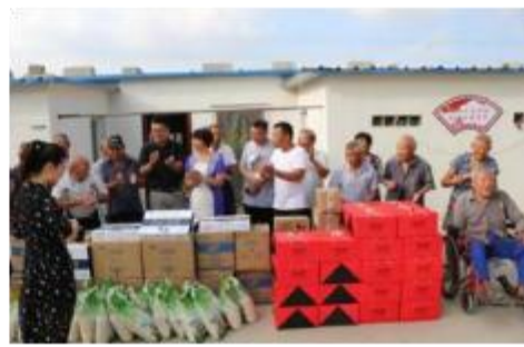
图表 2 - 9 慰问前庵居委会和罗土塘社区孤寡老