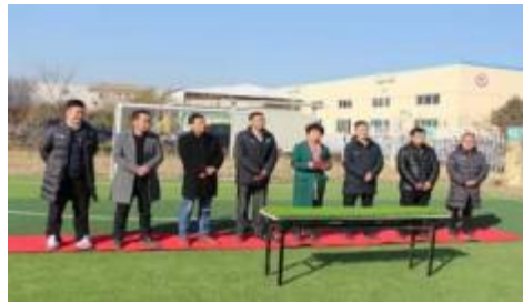
图表 2 - 8 慰问三棵树小学贫困生、向三棵树小学捐赠物资