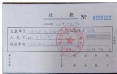
图表 2 - 10 赞助经开区教职工系统运动会