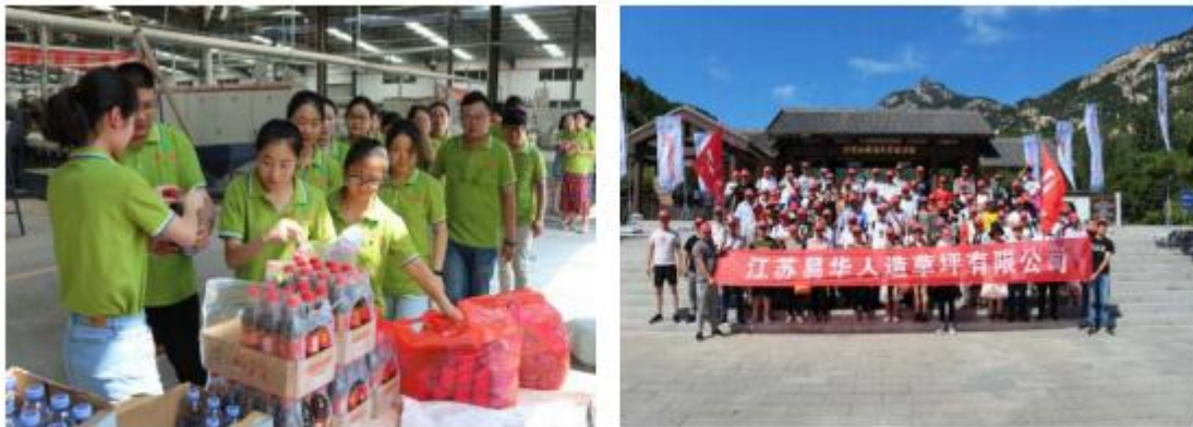
图表 2 - 5 夏日送清凉、员工旅游

江苏易华将创建全球最具竞争力的人造草坪企业，对内通过关爱员工的一系列举措来体现诚信。近年来企业经济效益的稳步提高，也让全体员工共享了企业发展的实惠，员工人均年收入以每年超过 8%-10% 的幅度提升，并写入了职工代表大会工作报告。