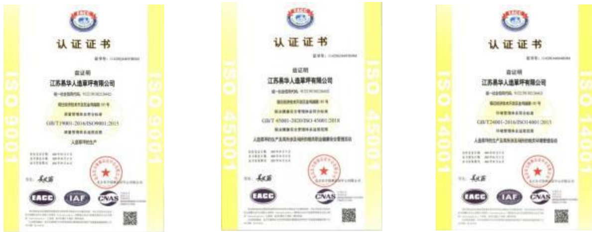
图表 2-1 公司获取的质量、环境、职业健康、知识产权体系证书

为谋求企业与社会和谐发展，公司在取得合理利润与经济效益以外积极履行社会公共责任和公民义务，在环境保护、能源消耗、安全生产等方面认真执行国家有关法律法规，通过导入实施 ISO 三体系，每年签订安全生产责任书，真正做到企业对社会负责。在道德行为方面一直创建诚信企业，兼顾顾客、员工、供方等权益的共赢。在公益事业方面也积极响应，以高层领导为带头，全部员工积极参与的方式来回馈社会。