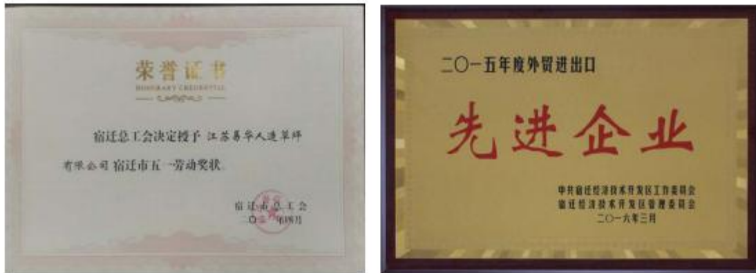
图表 2 - 4 五一劳动奖状、先进企业